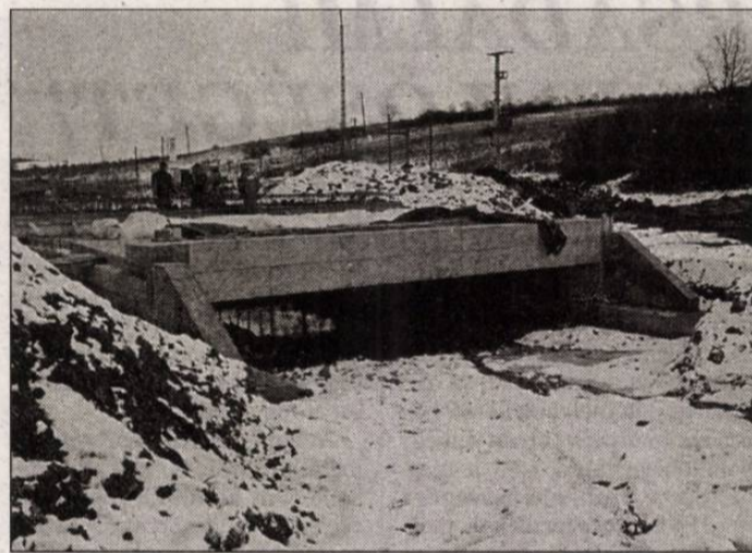
Elsőként a híd épült meg.

Maga az ipari hulladék-lerakó a téli időszakban is épül, s a